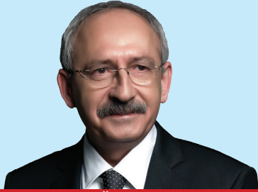
KEMAL KILIÇDAROĞLU CHP Genel Başkanı