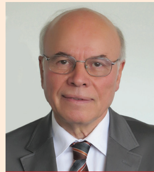
ERCAN KARAKAŞ CHP Genel Başkan Yardımcısı

Özgür sanat kültürü gelişmenin en önemli öğelerinden başında gelmektedir. O nedenle, uygar ve demokratik ülkelerde devlet, sanatı ve sanatçıları desteklemekle