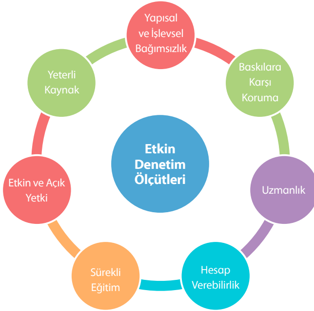
Şekil 5: Etkin Denetim Ölçütleri

AKP, kamu denetiminde yukarıda yer alan ilkelerin tamamının aksine uygulamalar içinde olmuştur. Yolsuzlukları tespit eden denetim raporları uygulamaya konulmamıştır. Bu raporları yazan denetçiler özlük haklarıyla ilgili ayrımcılığa tabi tutularak diğer denetçilere mesaj verilmiştir. Yolsuzlukları aklayan denetçiler terfi ettirilerek ödüllendirilmiştir. AKP'nin bu havuç ve sopa politikası bazı denetçiler arasında yolsuzlukları aklayarak terfi alma konusunda ilkesiz bir yarış başlatmıştır.