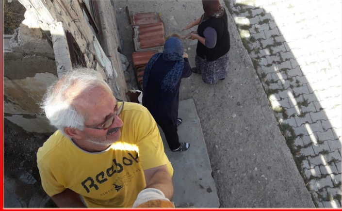
Yozgat Çayıralan'da imkanları kısıtlı bir ailenin çatı aktarmasını yaptık.

Katılımcılarımız, Üyelerin Temel Siyasi Eğitimi sertifikalarını alabilmek için, eğitim esnasında tasarladıkları sosyal projeleri hayata geçiriyorlar. Projelerimizden bazı fotoğrafları sizlerle paylaşıyoruz.