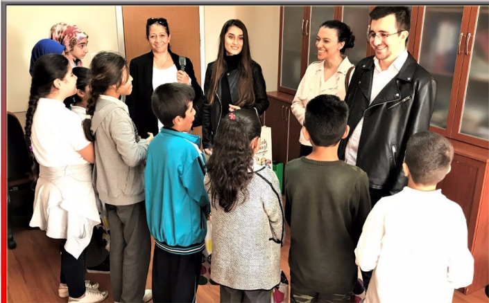
İstanbul'da belirlenen ilköğretim öğrencilerine kırtasiye yardımı gerçekleştirildi.