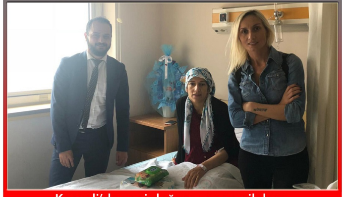
Kocaeli'de yeni doğum yapan ailelere bebek bakım malzemeleri götürdük.