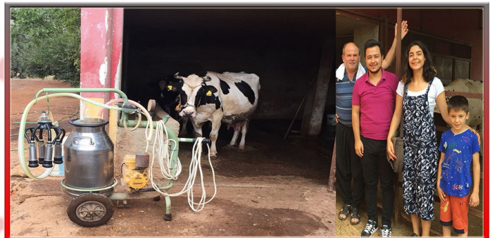
Mersin'de süt üreticisi bir aileye ürünlerini ulaştıracağı yeni bir kanal bulundu.