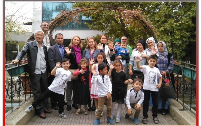
Sakarya'da belirlenen ilköğretim öğrencileri ve aileleri ilk defa lunaparka gittiler.