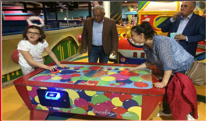
İstanbul'da engelli çocuklar ve aileleri ile oyunlar oynayarak keyifli saatler geçirdik.