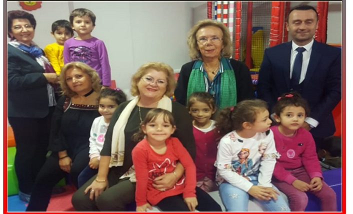
Kırklareli'de belirlenen ana okulu öğrencileri ilk kez oyun alanına gittiler ve çeşitli hediyeler aldılar.