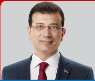
EKREM İMAMOĞLU İSTANBUL