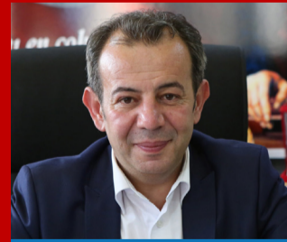
TANJU ÖZCAN BOLU