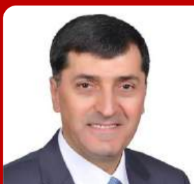
EYÜP KAHVECİ KÜTAHYA