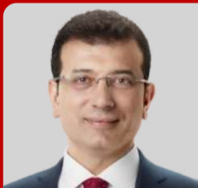
EKREM İMAMOĞLU İSTANBUL