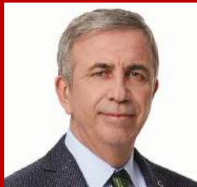
MANSUR YAVAŞ ANKARA