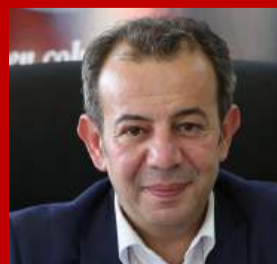
TANJU ÖZCAN BOLU