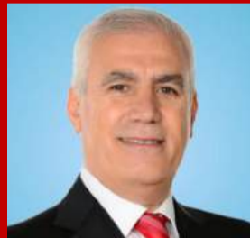
MUSTAFA BOZBEY BURSA