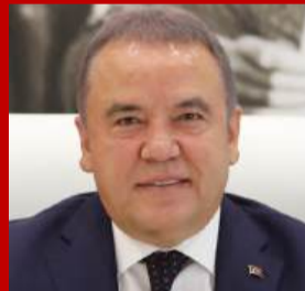
MUHİTTİN BÖCEK ANTALYA