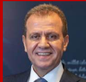
VAHAP SEÇER MERSİN