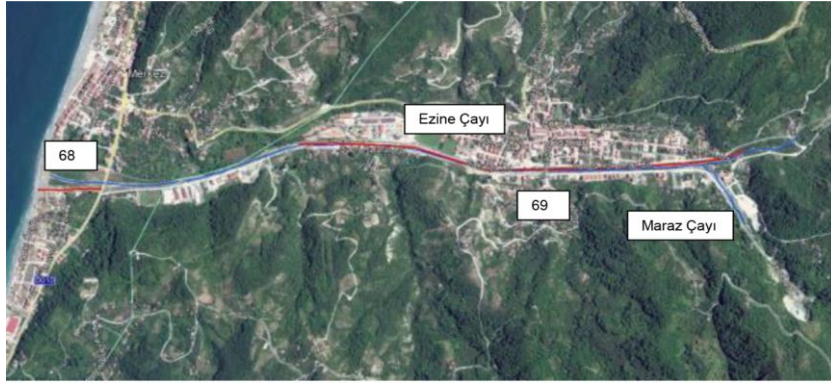
Harita 9-14: Kastamonu İli Abana ve Bozkurt İlçesi Uydu Görüntüsü

Tarım ve Orman Bakanlığı Su Yönetimi Genel Müdürlüğü tarafından yapılan Batı Karadeniz Havzası Taşkın Yönetim Planında, 2014 yılında da taşkın yaşanan Ezine çayı üzerinde incelemeler yapıldığı, çay yatağı üzerinden yapılan modellemelerde, derenin sağ sahilinin yüksek taşkın tehlike riskine maruza kaldığının uyarısı yapılmıştır. Planda, 2014 yılında Ezine çayı taşması sonucunda Abana ilçesi yerleşim yerleri ve ticaret alanları sular altında kaldığından da söz edilmektedir.