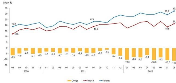
İhracat, ithalat ve dış ticaret dengesi, Ağustos 2022

Ekonomik faaliyetlere göre ihracatta, 2022 Ağustos ayında imalat sanayinin payı yüzde 95, tarım, ormancılık ve balıkçılık sektörünün payı yüzde 2,5, madencilik ve taşocakçılığı sektörünün payı yüzde 2,0 oldu.